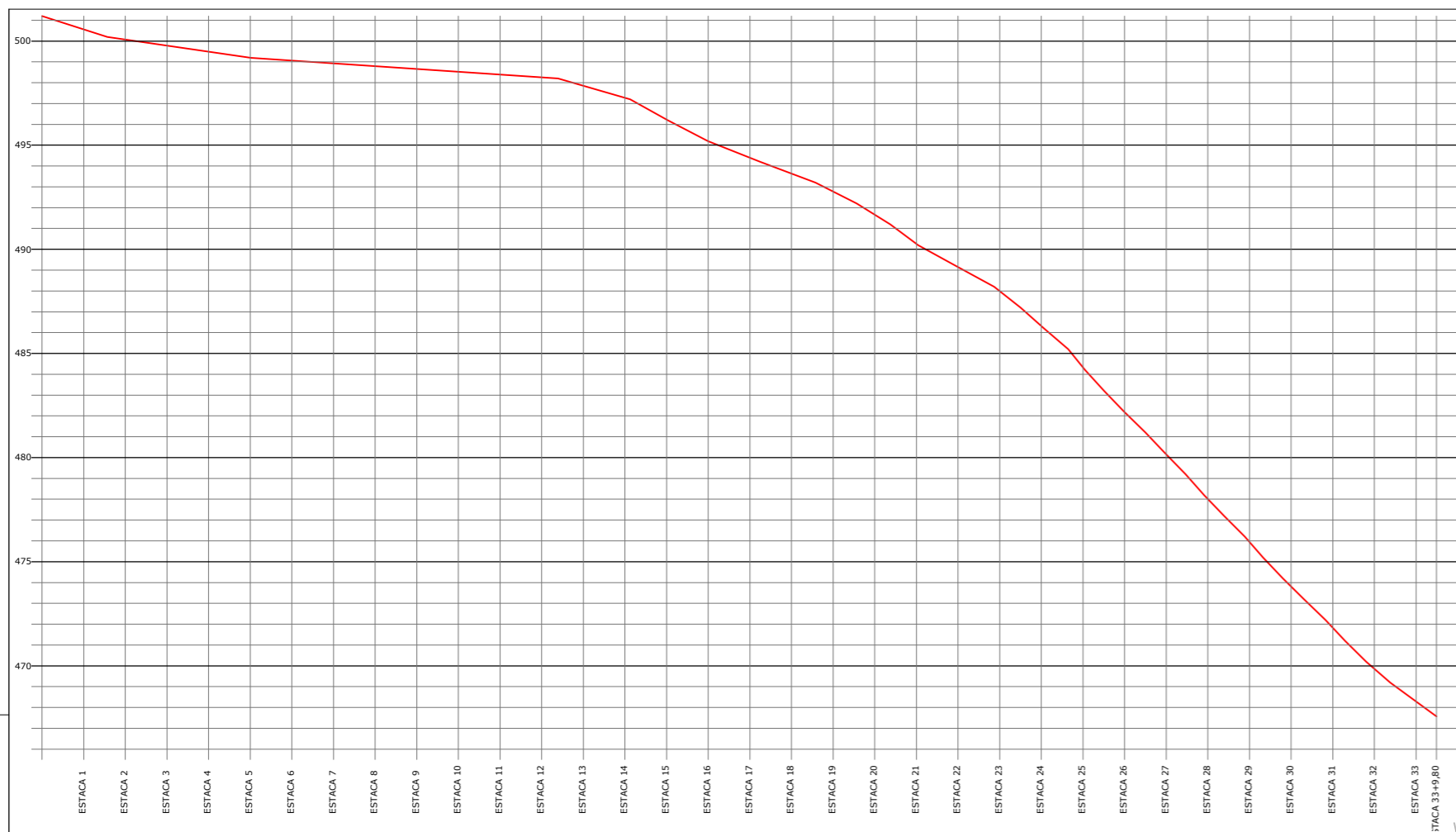
1 PERFIL LONGITUDINAL Escala: 1:3000 X:10Y